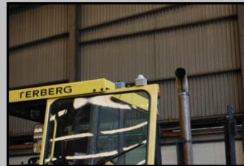
GPS und W-Lan